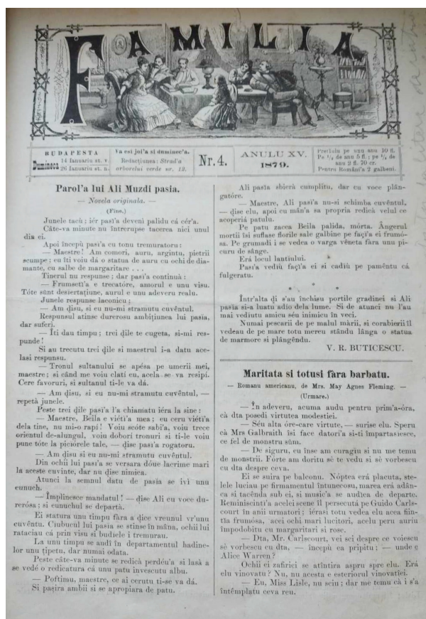
Revistele Șezătoarea și Familia aparținând Secției „Periodice” a Bibliotecii Județene „Petre Dulfu” din Baia Mare; foto: Corina Isabella CSISZÁR

român de aici, în mijlocul căruia a crescut, l-au determinat pe animatorul Familiei să prețuiască obiceiurile, datinile, portul și creațiile populare. Acestea au constituit fondul pe care s-au altoit influențele ulterioare și care n-au modificat convingerea lui potrivit căreia creația orală populară stă la baza literaturii noastre culte.