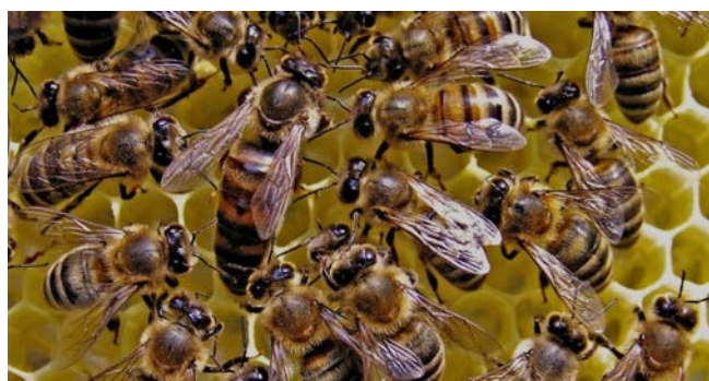
Fagure de miere

În Evul Mediu, mierea a jucat un rol primordial în alimentație, dar și în medicină. Chiar dacă zahărul din trestie este cunoscut încă din Antichitate, utilizarea lui rămâne foarte rară - până în secolul al XVII-lea, mierea era cea mai folosită în alimentație. De asemenea, era utilizată și la prepararea multor băuturi, jucând un rol semnificativ în terapia medievală. Pe lângă miere, oamenii extrăgeau de la albine și ceara, care era utilizată pentru iluminatul civil și mai ales religios. Iconografia medievală confirmă relația specială și privilegiată pe care oamenii și albinele au avut-o în această perioadă. Miniaturile medievale, însoțind surse literare, redau formele și materialele stupilor, locurile unde a fost instalată stupina, protecția ei și importanța sa ei în viața economică, medicală și spirituală. Începând cu secolul al XIII, apar numeroase enciclopedii care reunesc cunoștințe variate, rețete medicale și sfaturi practice referitoare la albine. 9