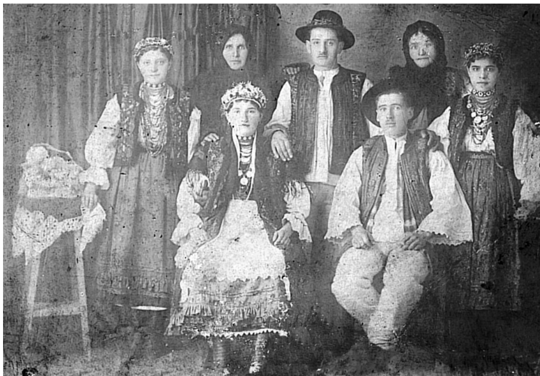
Miri din 1930

„ După terminarea ceremoniei, mirii, nașii, stegarul și druștele se întorc numai spre dreapta ” (spre sud, în sensul rotirii soarelui, în timp ce ceremonia cununiei prevede rotirea, în jurul mesei, în sens invers mersului soarelui pe cer; în localitate, încă există rămășițe ale cultului soarelui, n. Ș.A.) „ (Doamne fer, dacă o ar face spre stânga!) ” și se îndreaptă către ieșirea bisericii, timp în care mirii țin de o batistă cusută frumos de mână, semn că sunt legați.