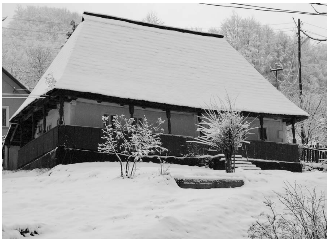
Casă din zona Codru