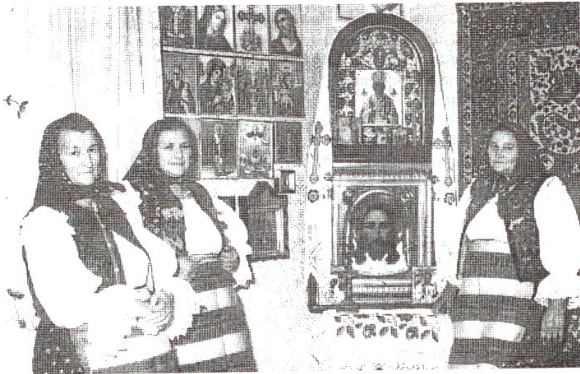
Femei din Slatina (Transcarpatia), la Biserica