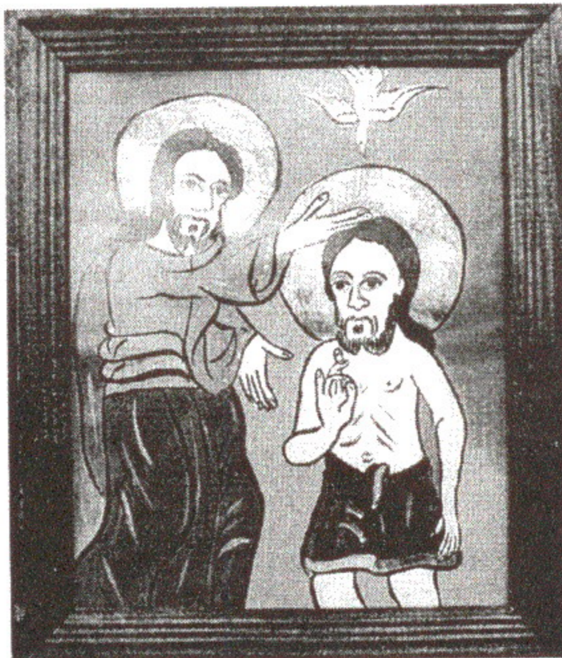
Valentin Ganța: Botezul Domnului, icoană pe sticlă de Georgeta Maria Ioga

Însă nici Sf. Dumitru, nici arhanghelii Mihail și Gavril nu oferă repere cronologice bisericii pentru a pune capăt unei lungi perioade "de dulce" și de libertăți sexuale legitime. Este o dată peste tot definită prin referință la