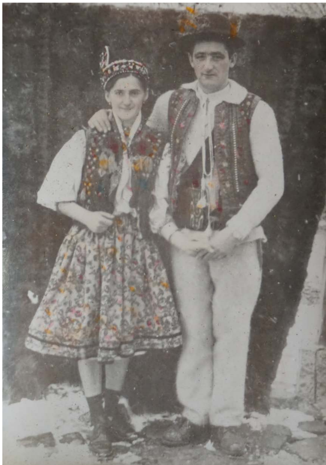
Miri din Sarasău