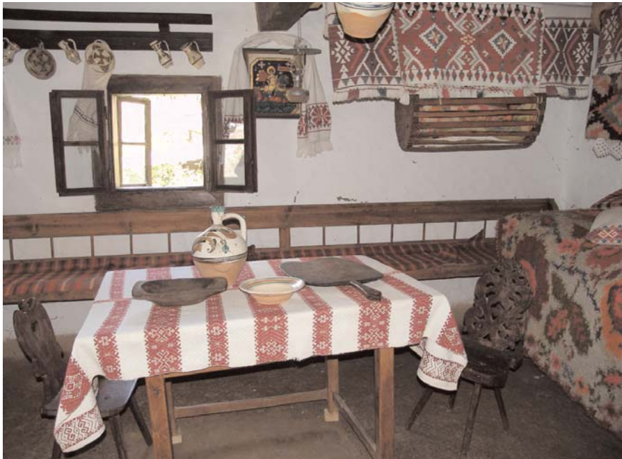
Interior țărănesc

Fereastra nu conotează foarte multe sensuri. Aceasta delimitează spațiul interior de cel exterior. Ca deschidere spre aer și lumină, fereastra simbolizează receptivitatea; fiind pătrată ea se referă la receptivitatea terestră în opoziție cu aportul cerului.