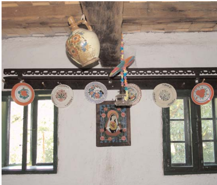
Interior țărănesc

Masa capătă o atenție deosebită, fiind acoperită cu o țesătură bogat ornamentată cu motive specifice zonei. Masa care reprezintă locul de așezare a darurilor, are o valoare augurală prin bogăția de produse etalate, cât și simbolică prin sensul fiecărui dar. Se spune la români Crăciunul sătulului pentru că sărbătoarea duce la o egalizare a stării sociale, pe care fiecare și-o exprimă prin bogăția conținutului mesei.