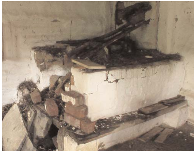
Cine se lăcomește la lucru altuia, nu-i tihne nici de al lui.

mediul său nemijlocit în momentele cruciale ale vieții individului și colectivității.