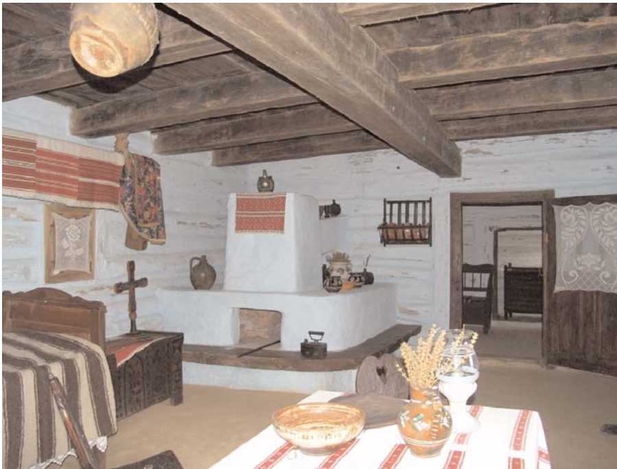
Interior țărănesc

Până la spălarea de păcate, lehuzei îi este interzis de a sta la masă și de a mânca împreună cu ceilalți membri ai familiei, existând credința că