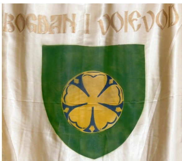
Blazonul Casei Bogdan Voievod

masonic” rosacrucian (corespunzător Gradului 18 al inițierii, de Cavaler al Crucii și trandafirului, un trandafir tot cu cinci petale). Desigur, Floarea cu cinci petale din blazonul lui Bogdan Vodă nu poate avea ascendență nici rosacruciană și nici masonică, pentru simplul motiv că Bogdan Vodă a domnit la Moldova între 1363-1367, deci cu trei – patru sute de ani înainte de apariția Ordinului Cavalerilor Crucii cu Trandafiri (rozacrucieni) și respectiv a masoneriei speculative. În veacul al XIV-lea în care a trăit Bogdan Vodă, floarea cu cinci petale mai este întâlnită în Anglia lui Henric al IV-lea. Regele Henric al IV-lea s-a aflat în exil între anii 1398-1400 și în timpul exilului a păstrat ca talisman norocos o floare de nu mă uita 7 . La revenirea pe tron, floarea cu cinci petale, sub forma concretă a florii de nu mă uita, a devenit un simbol al său și a constituit un semn de recunoaștere pentru nobilii care l-au sprijinit să capete tronul. Astfel, această floare a ajuns să simbolizeze nu doar memoria legăturilor dintre oameni, ci și atașamentul, fidelitatea, onoarea și devotamentul cuiva față de o persoană anume. Ca simbol masonic, floarea de nu mă uita apare mult mai târziu, în a