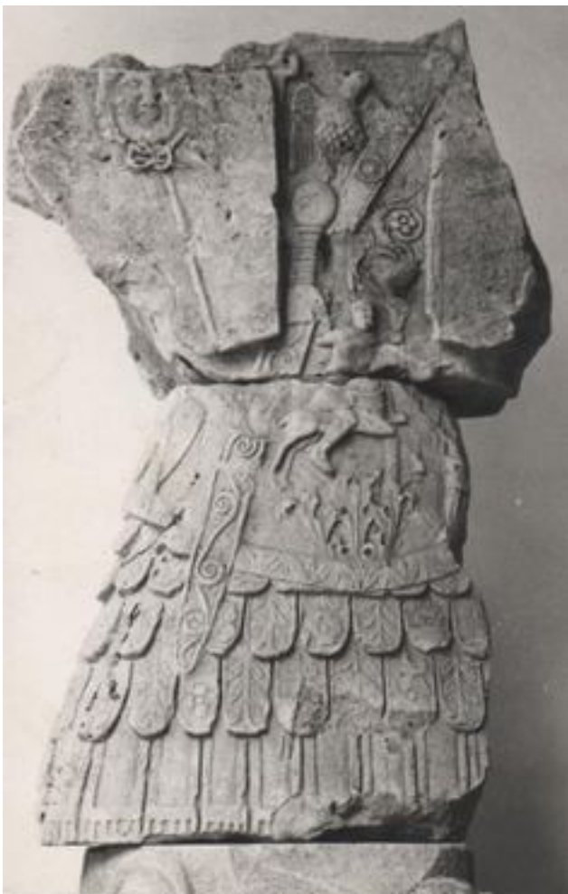
Asociația BD Tropeum Adamclisi

suprapunerea a două cruci cu brațele egale, o cruce fiind răsucită în raport cu cealaltă la 45 de grade. În bisericile din nordul Moldovei construite pe vremea lui Ștefan cel Mare, steaua în opt colțuri constituie fundalul aproape invariabil pe care este pictat Iisus Christos Pantocrator în cupola centrală, care înseamnă că Mântuitorul caută la lumea aceasta de sus din ceruri, sau Sfânta Fecioară Maria Theotokos deasupra altarului sau Dumnezeu-Tatăl, zis și Cel Vechi de Zile.