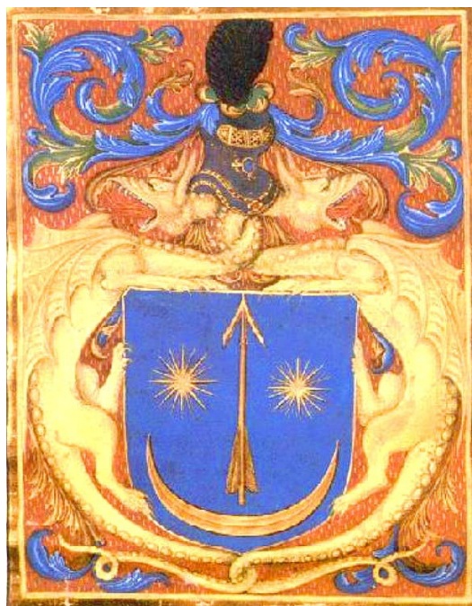
Asociația BD blazon Dragffy

Blazonul lui Dragoș Vodă nu este doar cel mai vechi, ci mai are însușirea că este și cel mai răspândit, geografic vorbind. Un strănepot de-al lui Dragoș Vodă, care a trăit un secol și jumătate după el și care se chema Birtoc iar cu numele maghiarizat de Bartolomeu Dragffy, din ramura Dragffy de Beltiug, ajuns principe al Transilvaniei (între 1493-1499) și fost cuscru al lui Ștefan cel Mare, a avut reședința la Ardud (undeva între Satu Mare și Zalău), în castelul ridicat de către el însuși. În acest castel se mai păstrează blazonul familiei, exact cu aceleași elemente heraldice de bază ca ale strămoșului său Dragoș Vodă Descălecătorul Moldovei, având în plus, lateral, în afara scutului, ca susținători, doi dragoni cu capetele de lup și cozile împletite, care apără blazonul ca atare. Adaosul este explicabil: