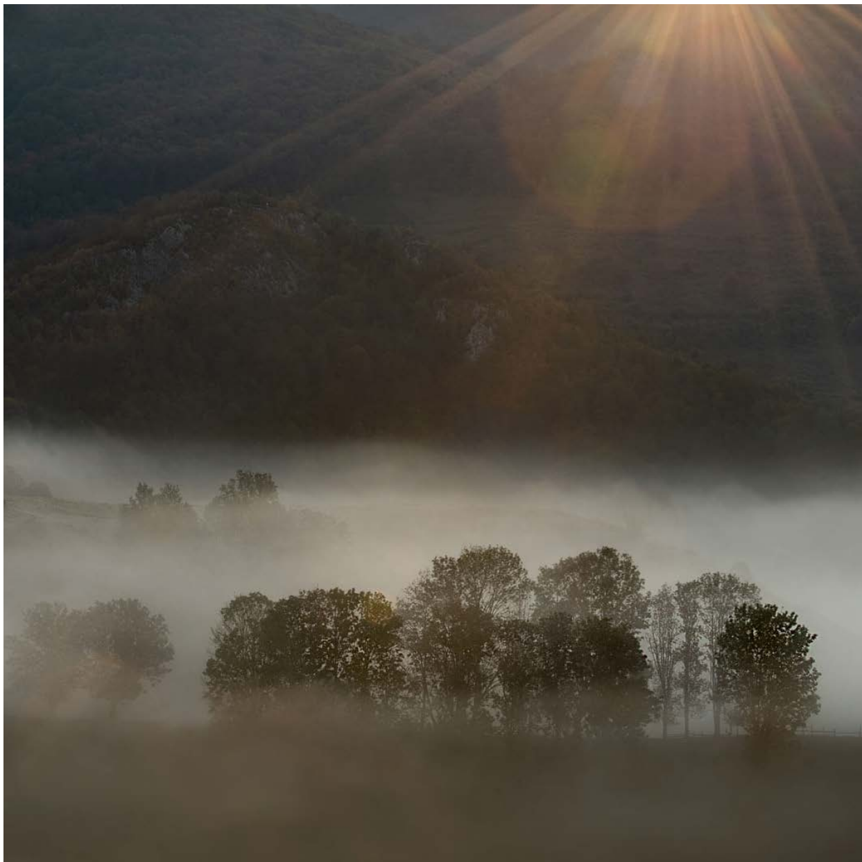
Zona pă unde hălăduie Fata Pădurii

io amu s-o petrecut amu-s mulți ai la Bloja. Eram mai mulți șindreșteni la lucru. Și într-o dimineață o văzut o babă umblând pântre vaci. Erau vaci la pășune, șindreștenii și șişeștenii aveau pășuni acolo și mânau sterpele, dițălele și boii. Ceia de mai pă aproape aveu și vaci de lapte, ciocotișăanii, blojenarii, poate și din alte sate.